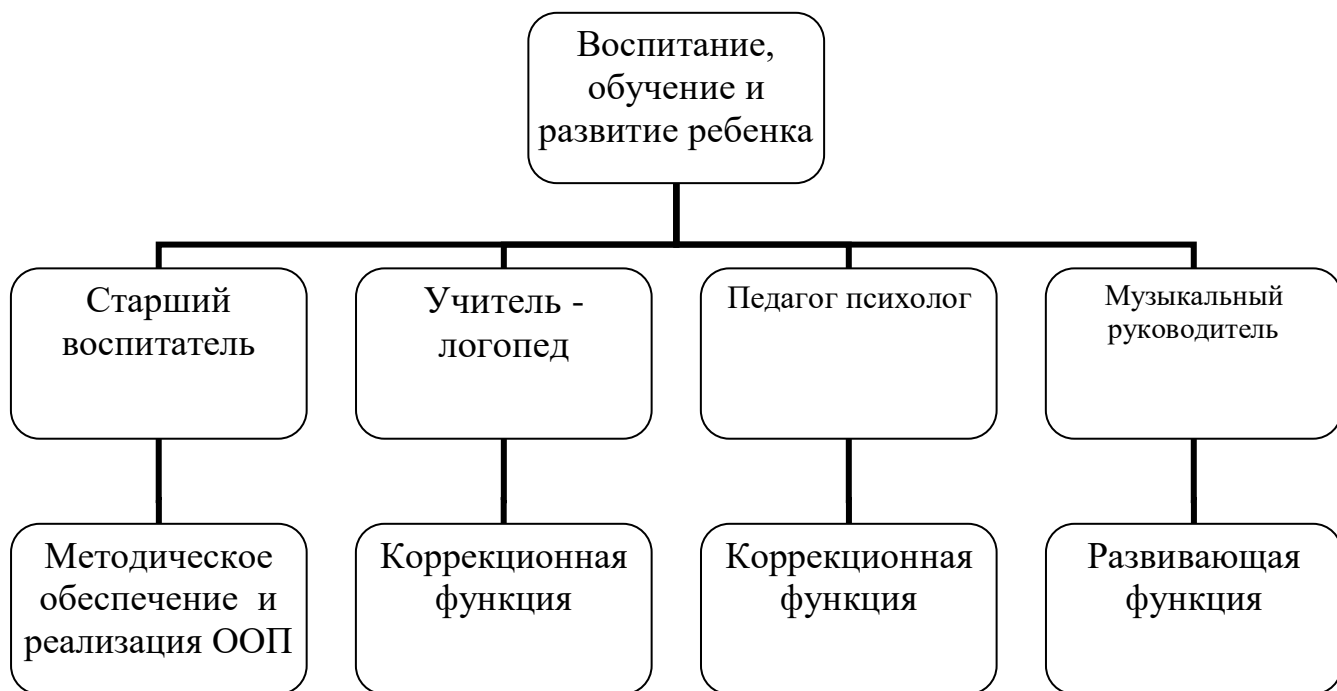
Схема взаимодействия специалистов ДОУ:

В настоящее время педагогический коллектив имеет творческий потенциал для дальнейшего развития.